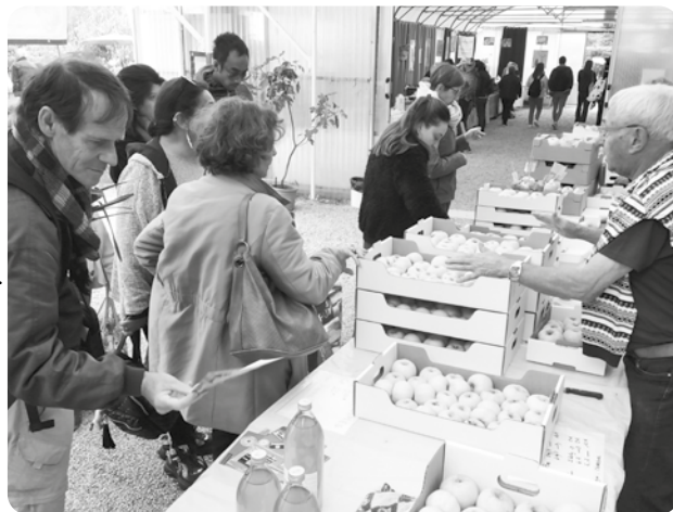
Avec le concours du groupe RSO, l'Alpa mène aujourd'hui des actions relevant du développement durable et de la transition écologique.