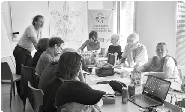
De l'importance de la réflexion collective pour construire le projet associatif.