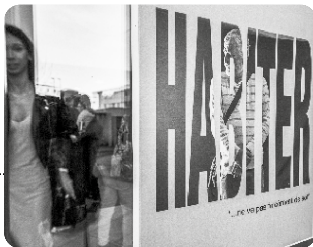
Affiche de l'exposition « HABITER ... ne vas pas forcément de soi » conçue avec nos partenaires « Cultures du Cœur » et « Les Petits Débrouillards ». L'inauguration a eu lieu le 10 Janvier 2023 à la Pension de famille « Les Pléiades ».