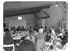
Séminaire de lancement de la révision du Projet Associatif 2024- 2028 , le Mardi 9 mai 2023.