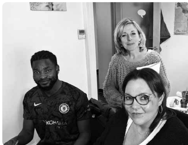
Favoriser l'insertion par le logement par l'accompagnement individuel et global.

Il s'agit de s'attacher à formaliser les engagements pris à leur endroit et plus particulièrement ceux visant à stipuler leur droit à la personnalisation de l'accompagnement.